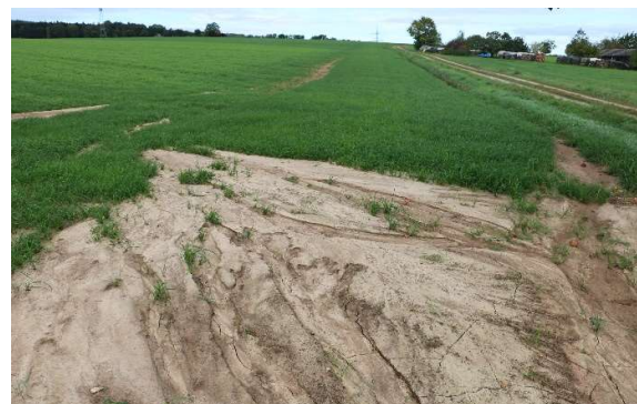
Abbildung 2: Erosion nach mehreren Starkregenereignissen in frisch gesättem Landsberger Gemenge im August 2023. Insbesondere in den Vorgewenden war die Fläche derart abgeschwommen, dass Feldgras nachgesät werden musste.

Die gravierendsten Erosionsereignisse kommen in der Regel bei Hackfrüchten vor. Jedoch gibt es Flächen, welche unabhängig der angebauten Kultur, vor allem im Vorgewende Probleme mit Erosion haben. Als Schutzmaßnahme kann u. a. das Vorgewende aus der Produktion genommen werden und kann zum Wenden der Maschinen genutzt werden. Die Bearbeitungsrichtung läuft somit über die gesamte Fläche quer zum Hang. Für diesen Zweck bietet sich ggf. das HALM-Programm C.3.3 (Erosionsschutzstreifen) an, wenn die Vorgewendebegrünung mind. 6 Meter breit sein kann.