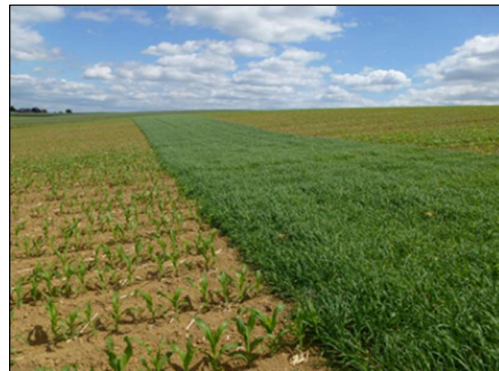
Abbildung 3: Erosionsschutzstreifen mit hoher Schutzwirkung (Wintergerste als Schutzstreifen).