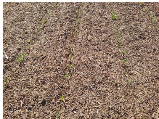
Abbildung 1: In Mulchsaat gestellter Mais zeigt nach einem Starkregenereignis keine Schäden.

Gelangt das Wasser von Feldwegen, Vorfluter oder Nachbarflächen auf die Fläche, muss diese Ursache behoben werden. Hierfür sind meist bauliche oder erdbauliche Veränderungen notwendig. Sammelt sich das Wasser hingegen auf der eigenen Fläche, sollte das Ziel sein, dass Wasser breit auf der Fläche versickern zu lassen auf der es auch niederregnet. Hier bietet sich statt der Grabenfurche die Anlage eines dauerhaften Begrünungsstreifens an.